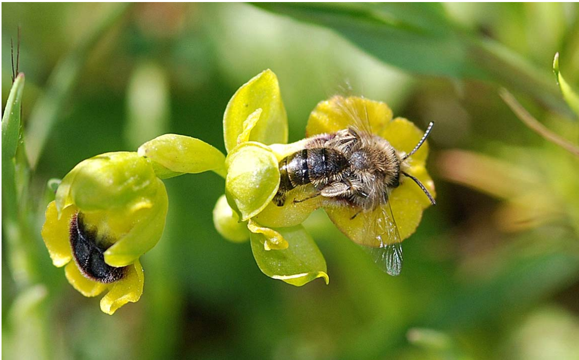
Pollinisation d' Ophrys lutea par un hyménoptère spécifique (F. Billi)

N'hésitez pas à apporter des documents et images relatifs à ce sujet.