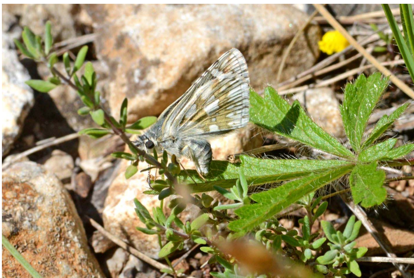
Pyrgus carthami pondant sur une potentille au Mont Chauve

Il existe aux portes de Nice un site naturel emblématique et facile d'accès : le Mont Chauve. Nous présenterons quelques aspects de la riche biodiversité de cette zone, observée au moment où elle s'exprime avec le plus d'exubérance : au printemps.