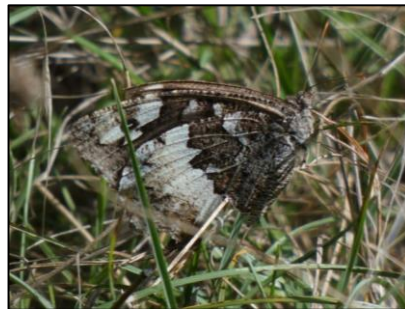
Silène Brintesia circe