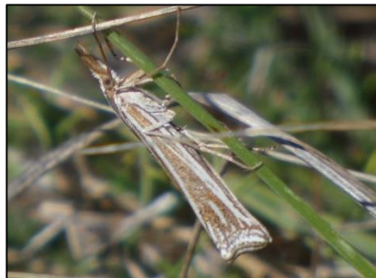
Ancylolome Ancylolomia sp