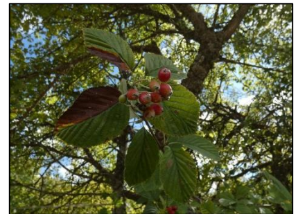
Sorbier des Alpes Sorbus aria