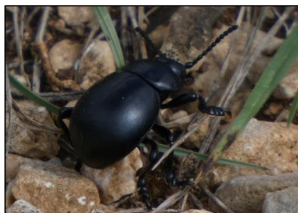
Crache-sang Timarcha tenebricosa