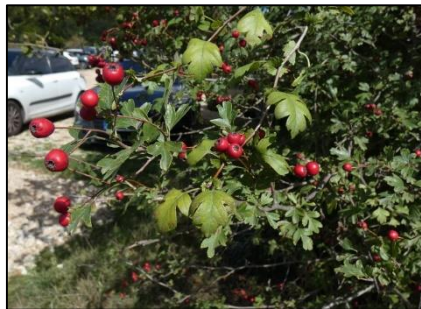
Aubépine à un style Crataegus monogyna