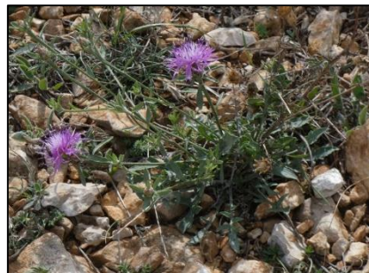
Centaurée paniculée Centaurea paniculata