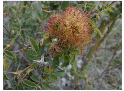
Galle Bédégar due au Cynips du rosier Diplolepis rosae