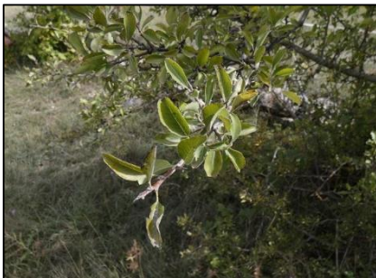
Poirier épineux Pyrus spinosa