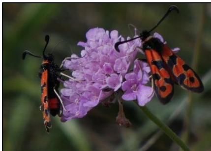
Zygène de la petite coronille Zygaena fausta