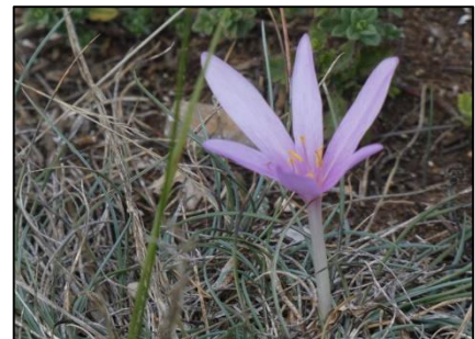
Colchique à longues feuilles Colchicum longifolium