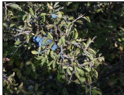
Prunelier Prunus spinosa