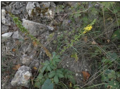
Aigremoine eupatoire Agrimonia eupatoria