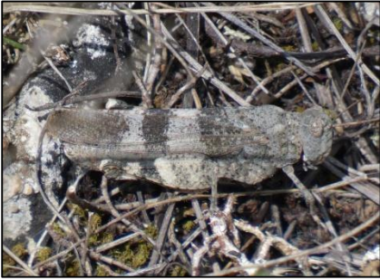
Criquet germanique Oedipoda germanica