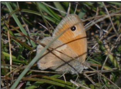
Procris Coenonympha pamphilus