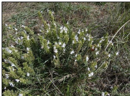
Sarriette des montagnes Satureja montana