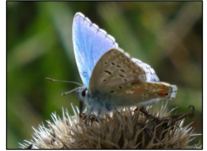
Argus bleu céleste Polyommatus bellargus