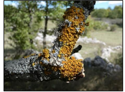
Parmelie des murailles Xanthoria parietina