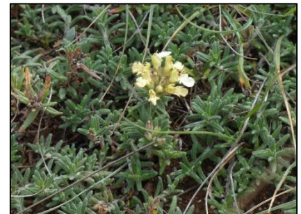
Germandrée des montagnes Teucrium montanum