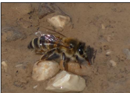
Abeille mellifère Apis mellifera