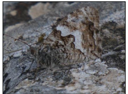
Agreste Hipparchia semele