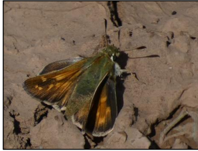
Comma Hesperia comma