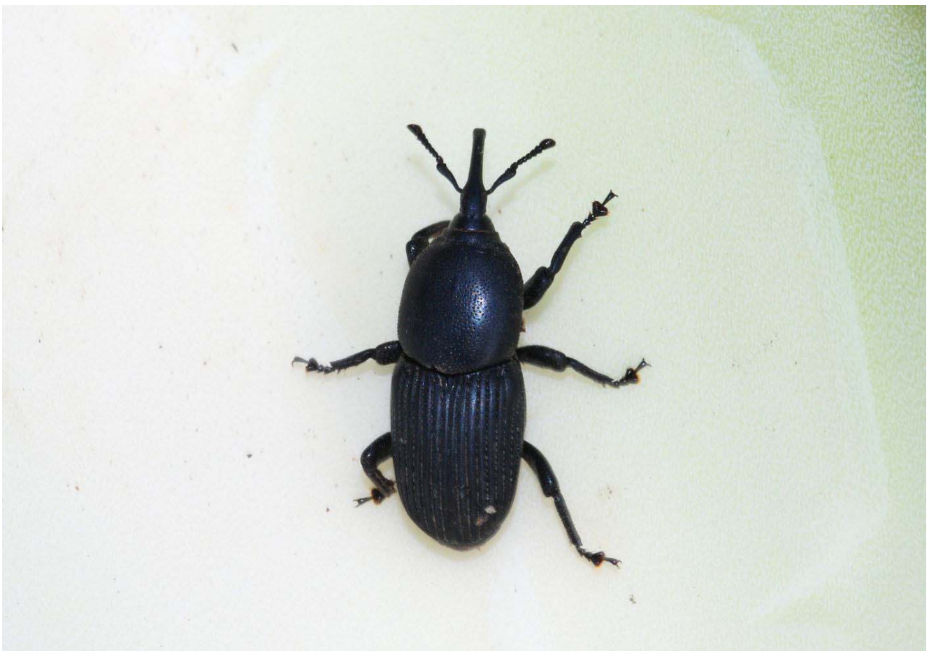
Un nouveau venu sur la Côte d'Azur: Scyphophorus acupunctatus (le charançon des agaves), originaire du Mexique. Villeneuve-Loubet, janvier 2017.

Pas de réunion qui sera remplacée, comme nous le faisons habituellement à cette période, par une sortie nocturne sur le terrain. Le lieu et la date précise n'étant pas encore fixés, vous pouvez contacter Frédéric Billi (fred.billi@wanadoo.fr) fin mai ou au tout début juin pour obtenir les informations nécessaires.