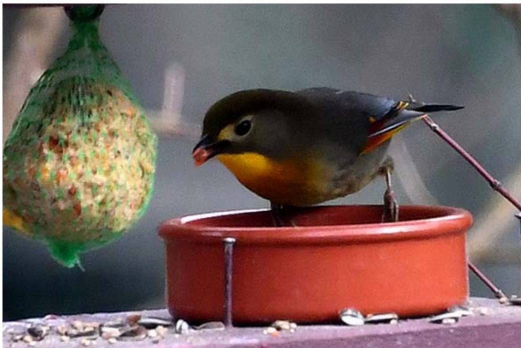
Leiothrix lutea.

[Sources d'info : différents sites Internet]