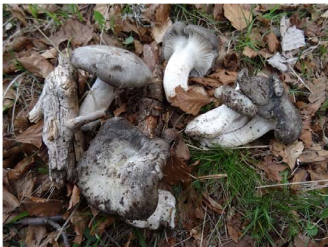
Hygrophorus marzuolus

Coordonnées GPS : UTM 32T x=0367751 y=4863718, Lat/long N 43°54'53" E 7° 21' 10".