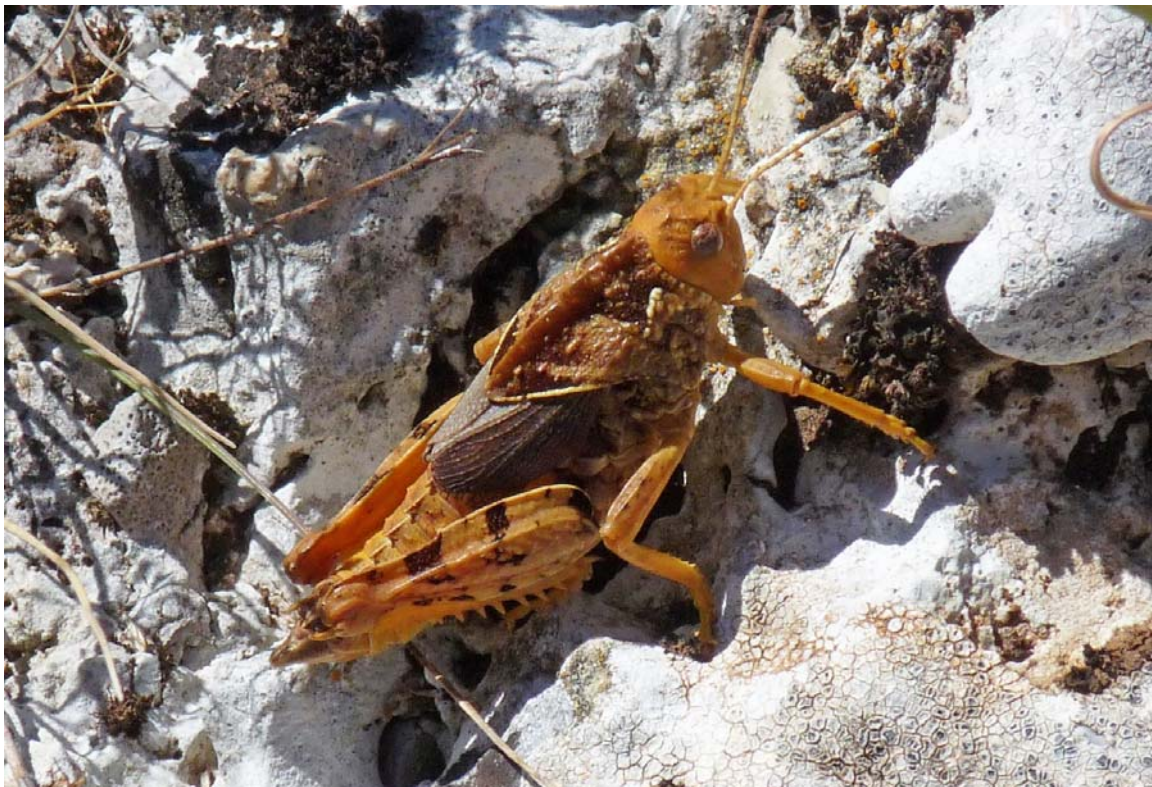
Crique Hérison à Gréolières-les-Neiges.

Jean-Pierre Fromentin continue de nous faire découvrir les richesses naturalistes de notre arrière-pays. Après les Plateaux de Calern et Caussols l'an dernier, il nous emmène ce soir dans un autre secteur calcaire remarquable : les environs de Gréolières - les - Neiges. Avec le Cheiron en toile de fond (l'un des hauts sommets les plus proches de la Méditerranée), cette zone recèle des biotopes d'un très grand intérêt faunistique et floristique que Jean-Pierre Fromentin a beaucoup exploré ces derniers temps et dont il va nous livrer les secrets, avec son enthousiasme habituel. Une belle soirée d'entomologie régionale en perspective !