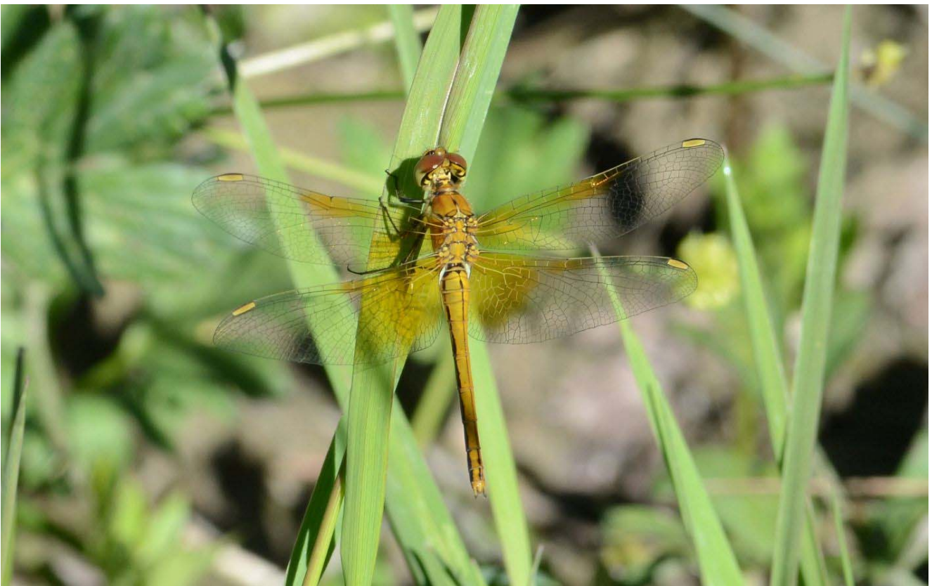
Sympetrum flaveolum photographié lors de l'«Explor'Nature Barcelonnette» en juillet 2017

Les membres de l'ANNAM sont régulièrement associés à des inventaires faunistiques dans les Alpes-Maritimes et les régions limitrophes. Ces actions peuvent être ponctuelles, comme c'était le cas à Barcelonnette en juillet 2017, ou bien s'inscrivent dans la durée en permettant de suivre l'évolution de la faune au fil des saisons (par exemple dans les gorges de Daluis ou dans la prairie de la Brague). Souvent, ces études permettent de révéler des éléments faunistiques très intéressants. Cette réunion sera donc consacrée à la présentation des résultats obtenus par les entomologistes qui participent à ces études sur le terrain.