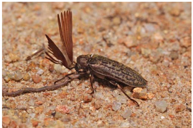
Callirhipis philiberti Coléoptère Callirhipidae