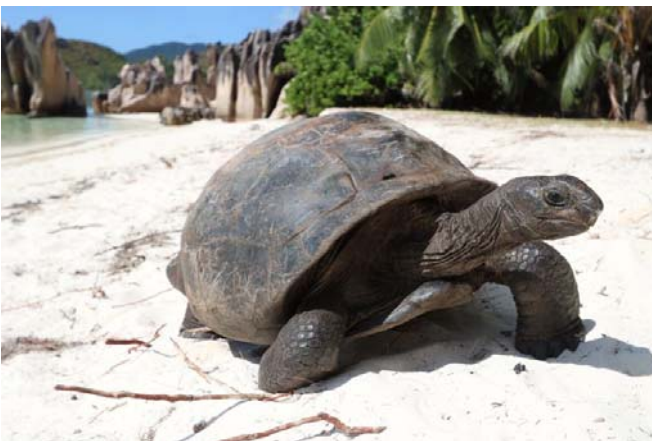
Aldabrachelys gigantea Tortue géante des Seychelles

Si la plupart des îles océaniques sont d'origine volcanique ce n'est pas le cas des plus grandes îles Seychelloises, granitiques. Ce granite, qui donne parfois aux Seychelles des airs de l'île de beauté, témoigne de l'ancienneté de l'archipel. Ce grand âge géologique implique donc une histoire évolutive très différente des îles volcaniques, et donc une biodiversité très particulière.