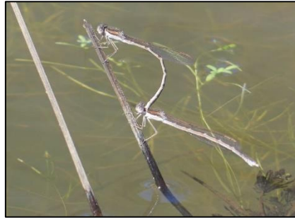
Leste brun Sympetma fusca