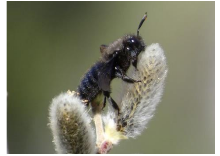
Xylocope violacé Xylocopa violacea