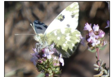
Marbré de vert Pontia daplidice