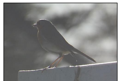
Rougegorge familier Erithacus rubecula