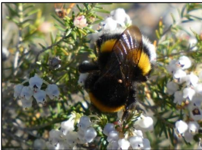
Bourdon terrestre Bombus terrestris