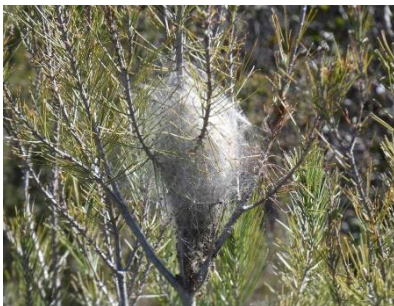
Chenille processionnaire du pin Thaumetopoea pityocampa