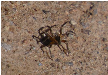
Araignée Epeire diadème Araneus diadematus