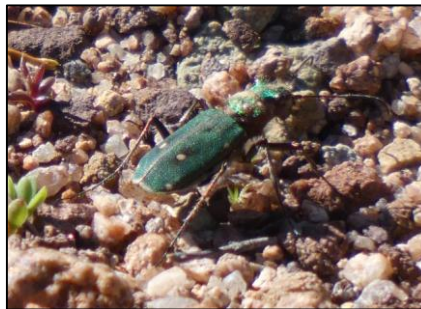
Cicindèle champêtre Cicindella campestris