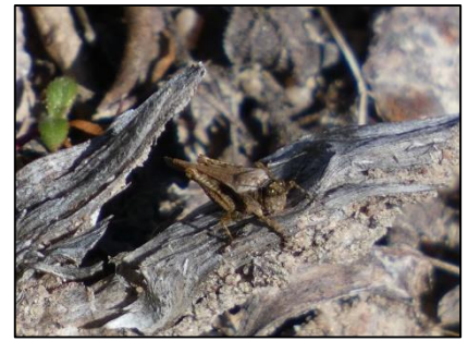
Tétrix des plages Paratettix meridionalis