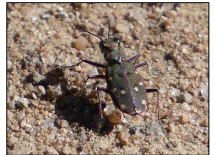
Cicindèle marocaine C. maroccana pseudomaroccana