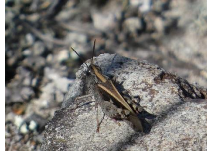
Criquet des Ibères Ramburiella hispanica