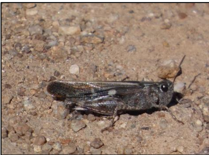
Criquet / Aïolope automnale Aiolopus strepens