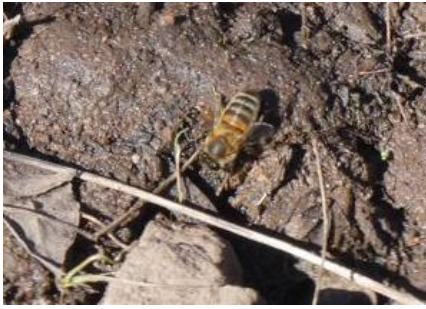
Abeille mellifère Apis mellifera