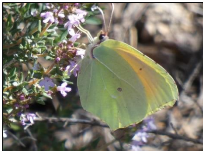
Citron de Provence Gonepteryx cleopatra