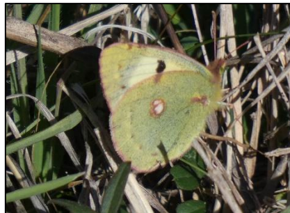
Souci Colias crocea