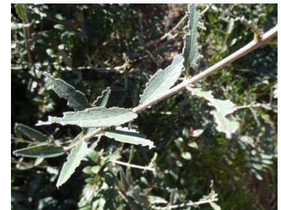
Mégachile sp (Abeille coupe feuilles)