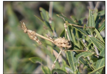
Empuse (Larve) Empusa pennata