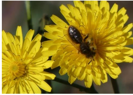
Petite abeille solitaire sp