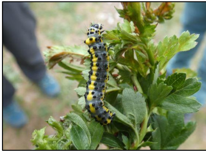
Double oméga Diloba caeruleocephala