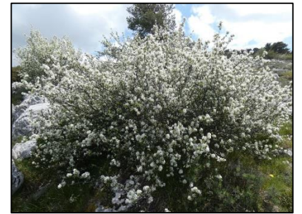
Amélanchier à feuil ovales Amelanchier ovalis