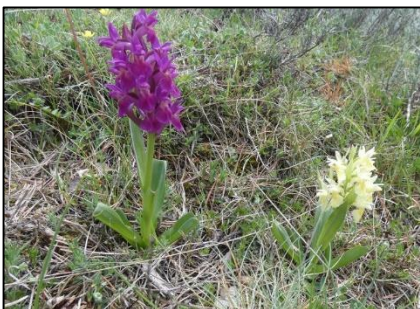
Orchis sureau Dactylorhiza sambucina