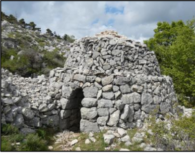
Borie Col du Clapier