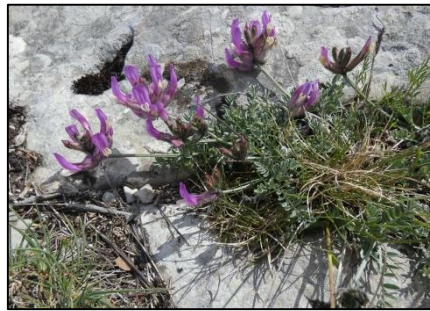
Astragale vésiculeux Astragalus vesicarius