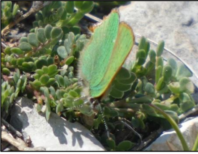
Argus vert Callophrys rubi