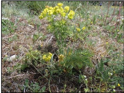
Euphorbe petit cyprès Euphorbia cyparissias