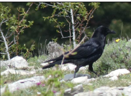
Corneille noire Corvus corone