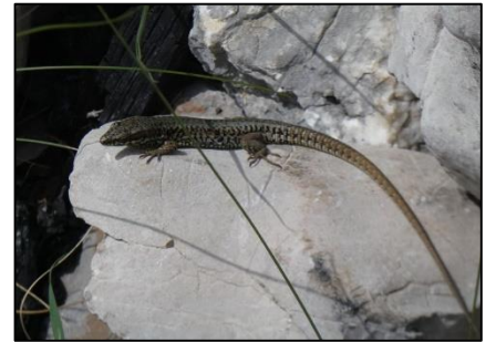
Lézard des murailles Podarcis muralis