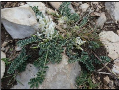
Astragale prostrée Astragalus depressus