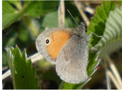
Procris Coenonympha pamphilus