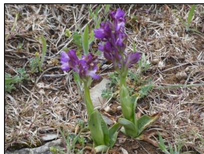
Orchis bouffon Anacamptis morio