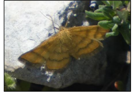
Acidalie des alpages Idaea aureolaria