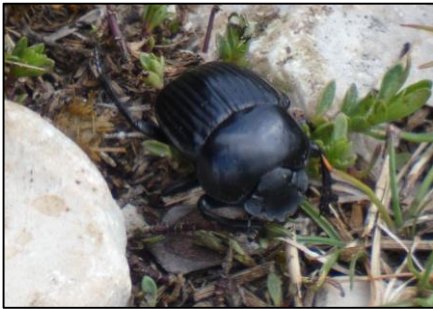
Bousier commun Scarabaeus laticollis