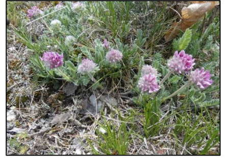
Anthyllide des montagnes Anthyllis montana