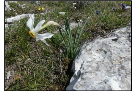
Narcisse des poètes Narcissus poeticus