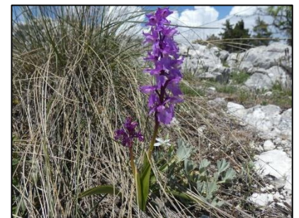
Orchis male Orchis mascula