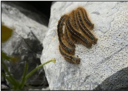
Bombyx à livrée Malacosoma neustria