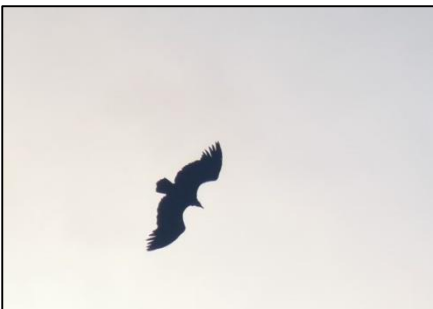
Vautour fauve Gyps fulvus