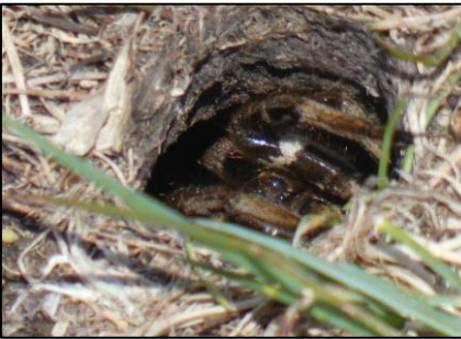
Lycose de Narbonne Lycosa narbonensis