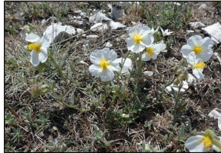
Hélianthème des Apennins Helianthemum apenninum