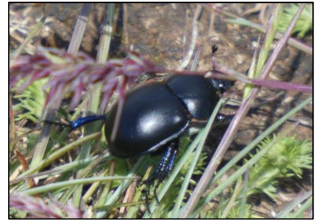
Bousier Geotrupes sp.