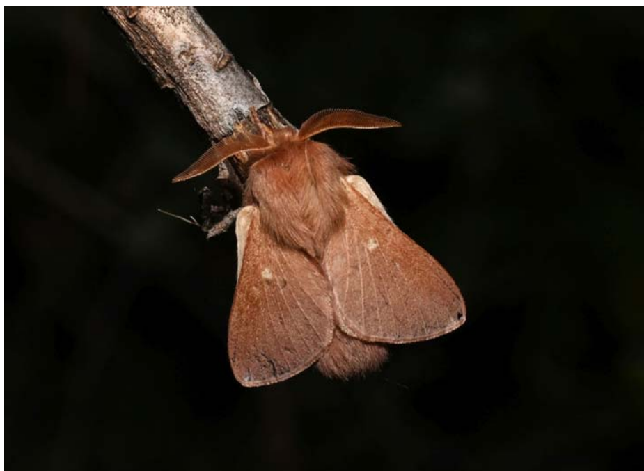
Eriogaster rimicola , « La Laineuse du Chêne », l'un des derniers papillons observés fin novembre lors de l'inventaire de La Colle sur Loup

Vous trouverez en décembre un bilan de ce travail et une liste des espèces inventoriés sur notre site internet , à la rubrique « section entomologie ».