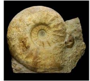
Moulage de Parapuzosia seppenradensis

Cette année, la 38ème édition du Salon des Minéraux, Fossiles et Pierres taillées, s'est déroulée sous le format d'une trilogie événementielle, trilogie dont le dénominateur commun s'est vu être celui des minéraux terrestres et extra terrestres, enrichi de l'empreinte de notre passé matérialisée par l'un des trésors que le Muséum d'Histoire Naturelle de Nice a bien voulu nous mettre à disposition pour l'occasion : la copie de la plus grande ammonite au monde connue à ce jour, Parapuzosia seppenradensis , nous contemplant avec son diamètre de près de deux mètres.