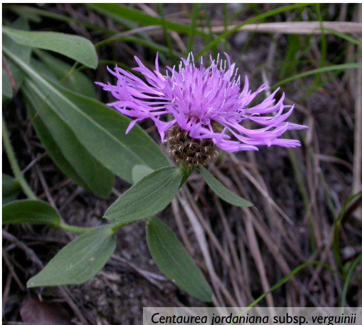
Centaurea jordaniana subsp. verguinii