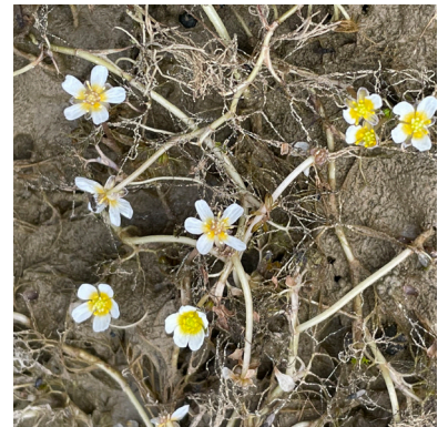
Ranunculus trichophyllus eradicated